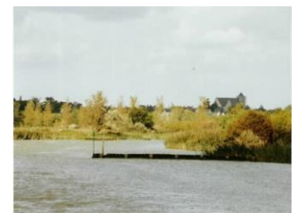
Bras de Cordemais marque latérale tribord

Vous entrez maintenant dans le bras de Cordemais (quelques marques "latérales" à l'entrée du bras). Naviguer plutôt sur bâbord, vitesse limitée 5 nœuds. Malgré la marée montante, un léger courant contraire peut se faire sentir. Les fonds sont constitués d'une épaisse couche de vase très fluide. La hauteur d'eau à mi-marée est d'environ 3.0 m, soit une hauteur suffisante pour venir au port si l'on était à l'étale de basse mer à l'entrée de la Loire.